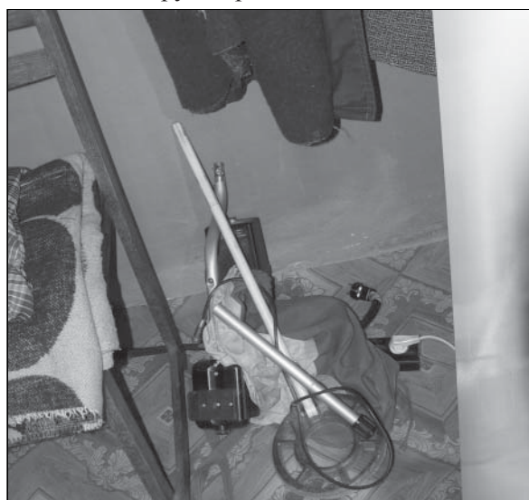
Металотърсачът, иззет от дома на Атанас Стойчев.

В къщата проверяващите откриват още и металотърсач, заедно със скрити културни ценности: 33 метални пластини, наподобяващи монети, 17 метални парчета с различна форма и големина, 1 бр. метален пръстен, метална сфера с топчета и други предмети.