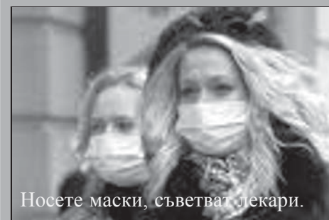
Носете маски, съветват лекари.

Във всички региони на Югозападна България е обявена грипна епидемия. Заболяемостта от грип в страната ще нараства и напред. Най-вероятно пикът на епидемията ще бъде в началото на февруари.