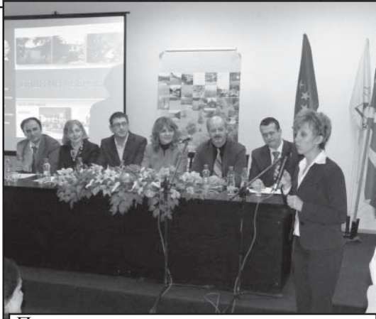
Пред препълнената зала от участници на форума: "Потенциалът на Берово, като дестинация за алтернативен туризъм".