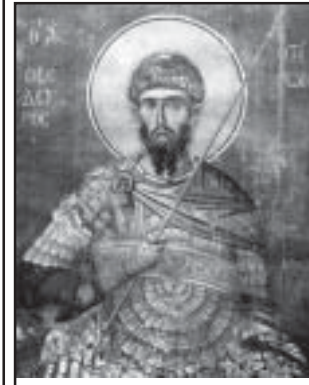
Св. Теодор Тирон

Съботният ден от първата седмица на Великия пост е в памет на Св. великомъченик Теодор Тирон. В народния календар е Ден на коневъдството и конния спорт. Празникът е известен още като Тодорова събота, Конски Великден, Тудорица. Празнува се здравето на конете. Още при изгрев слънце мъжете отиват в обора, сресват и сплитат опашките и гривите на конете, украсяват ги с мъниста, пискюли, цветя и ги отвеждат ритуално на водопой. После се прави конно състезание - кушия. Почитането на Св. Теодор е засвидетелствано още в ранните векове на Църквата.