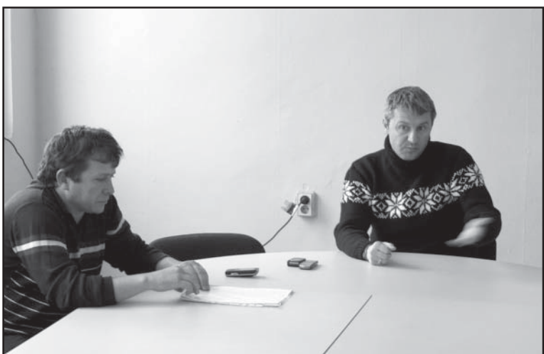
Кадрите са повече от показателни: Стиснат юмрук, стоварен върху масата и поглед насочен към другия й край... поглед, събрал в едно недоумение и гняв и в същото време търсещ отговор на въпроси, задавани всеки ден от жителите на една седем хилядна община...

Кметът настоя за по-адекватни и навременни действия от изпълнителите при усложнена зимна обстановка и очакващите се нови валежи.