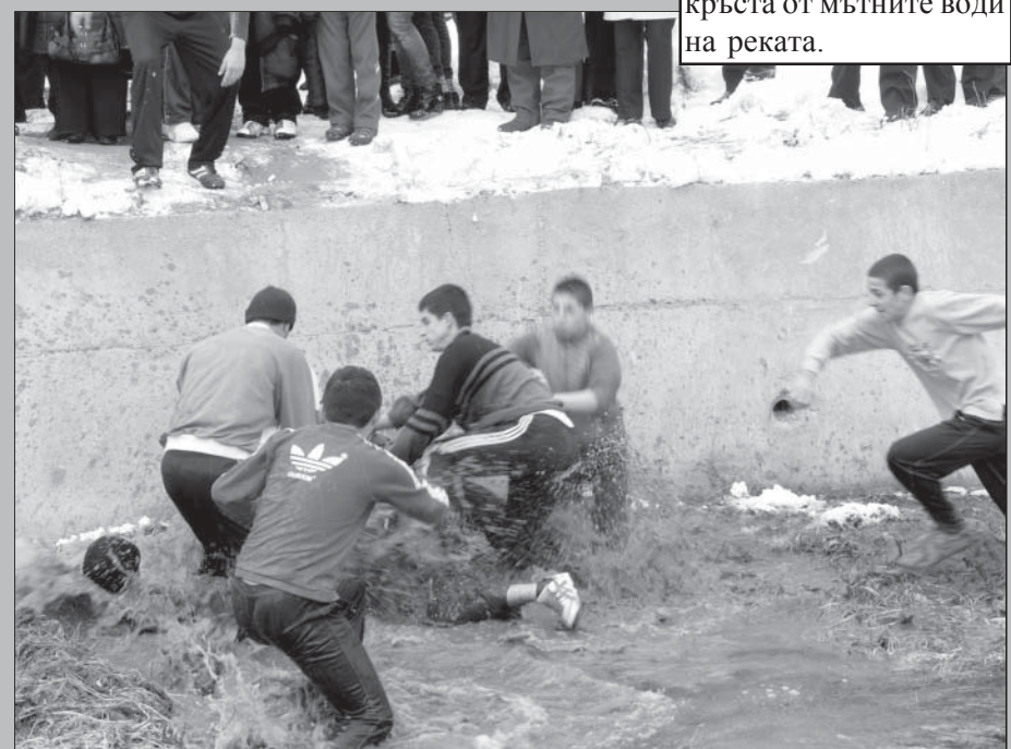
10.15 часа - Битка за крста във водите на река Шашка, с.Струмјани