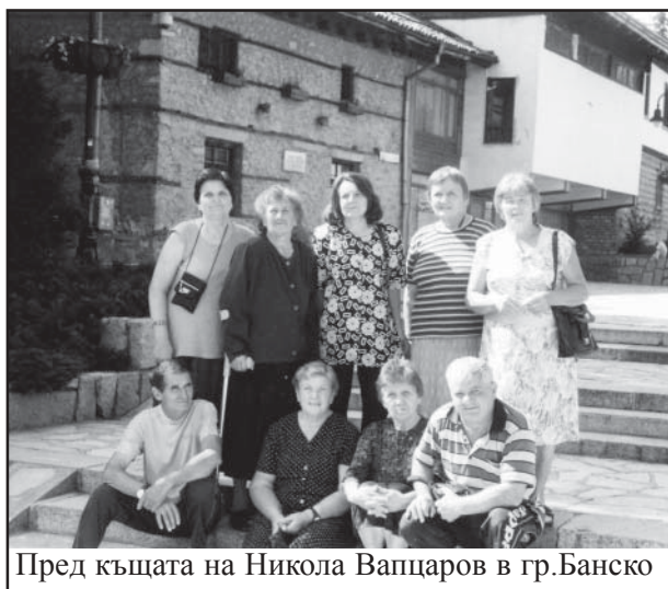
Пред къщата на Никола Вапцаров в гр.Банско

Приключихме срещата с общи снимки за спомен. Разделихме се като приятели, с пожелание за нови срещи и на наша територия.