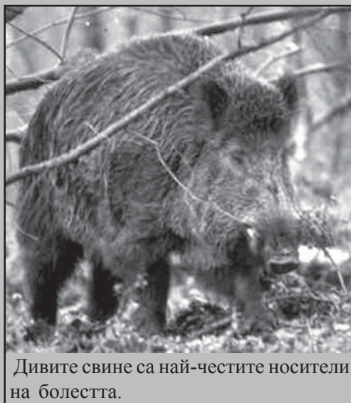
Дивите свине са най-честите носители на болестта.