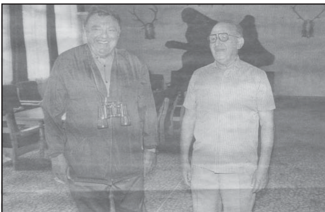
Тодор Живков и Франц Щраус в зала с ловни трофеи при предишно посещение в България през август 1987 г.

В България година по-късно Щраус е точно толкова нахакан, колкото и в Москва. На форума той държи речта си, в която обявява липсата на всякаква перспектива и икономическата нише-