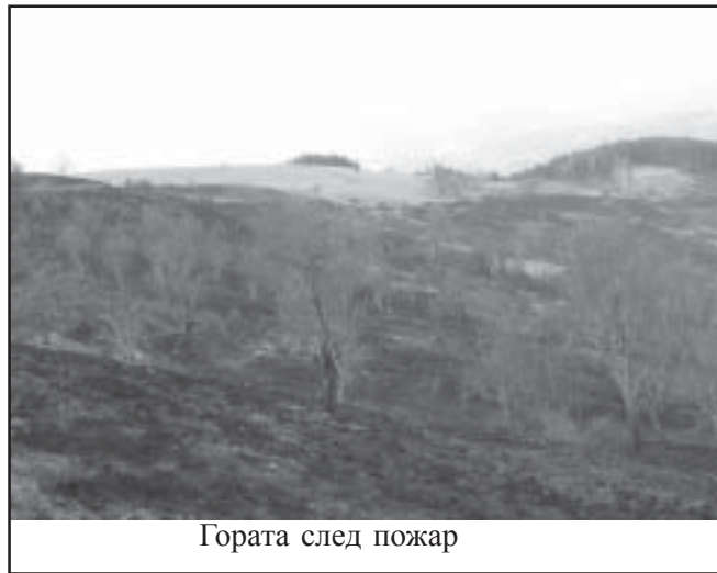
Гората след пожар

Собствениците (ръководители) на обекта (сградата) и организаторите на мероприятия са длъжни да осигуряват безопасност на хора