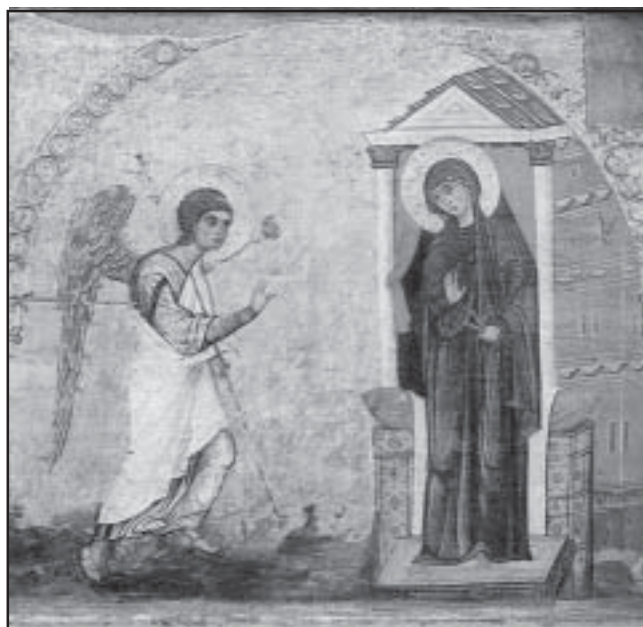
Архангел Гаврил съобщава на Дева Мария благата вест

Освен Благовещение, както е отбелязан в християнския календар, денят се нарича още Благовещ, Благоец, Благо-стене, Благовден, Благо-щение, Половин Великден, Куковден. Ако