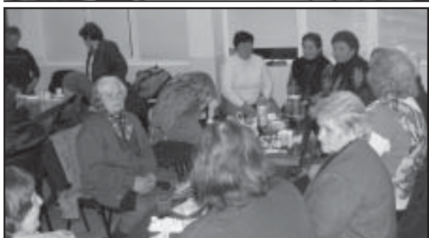
Пенсионерките от Струмияни доказаха, че красотата на човешката душа не остарява.