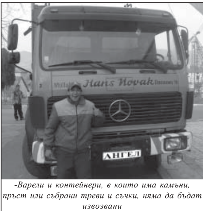
-Варели и контейнери, в които има камъни, пръст или събрани треви и съчки, няма да бъдат извозвани

5. Изхвърлянето на отпадъци от производствени и търговски обекти, заведения за обществено хранене, административни и жилищни сгради, в кошчетата за улична смет.