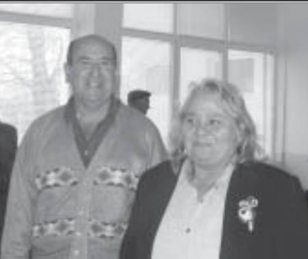
Рамо до рамо настоящ и бъдещ пенсионер

отношение към всички, като му пожелава преди всичко здраве, щастие и заслужени спокойни дни, заобиколен от много правнуци.