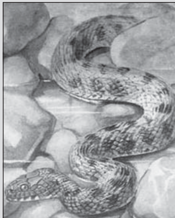
Пепелянката и усойницата са най-опасните видове змии в нашите географски ширини

- да бягате, да викате, да извършвате резки движения.