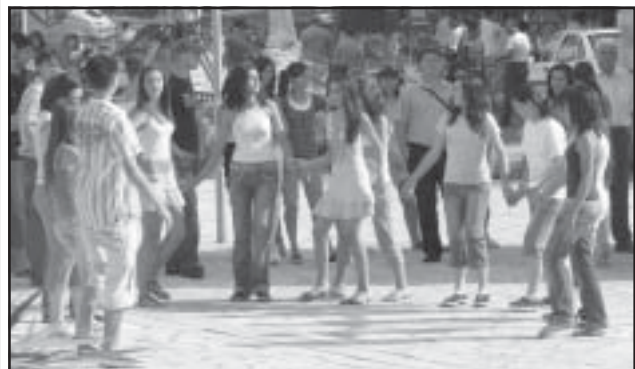
Докато зурнаджиите свиреха, на площада се вихреха хора

В юнската съботна вечер единадесет зурнаджийски групи пет часа се надсвирваха пред многобройна публика на площада в Струмьяни. Участие във фестивала взеха групи от югозападна България.