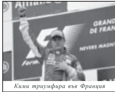
Кими триумфира във Франция

Райконен спечели последното състезание на пистата Маникур. Втори след него завърши съотборникът му Фелипе Маса, който стартира от първа позиция, а в последствие направи и най-бърза обиколка.