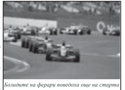
Болидите на ферари поведоха още на старта

Райконен се връща в борбата за титлата, а Ферари намаляват разликата си с Макларън Мерцедес на 25 точки. Следващият старт от календара е този уикенд