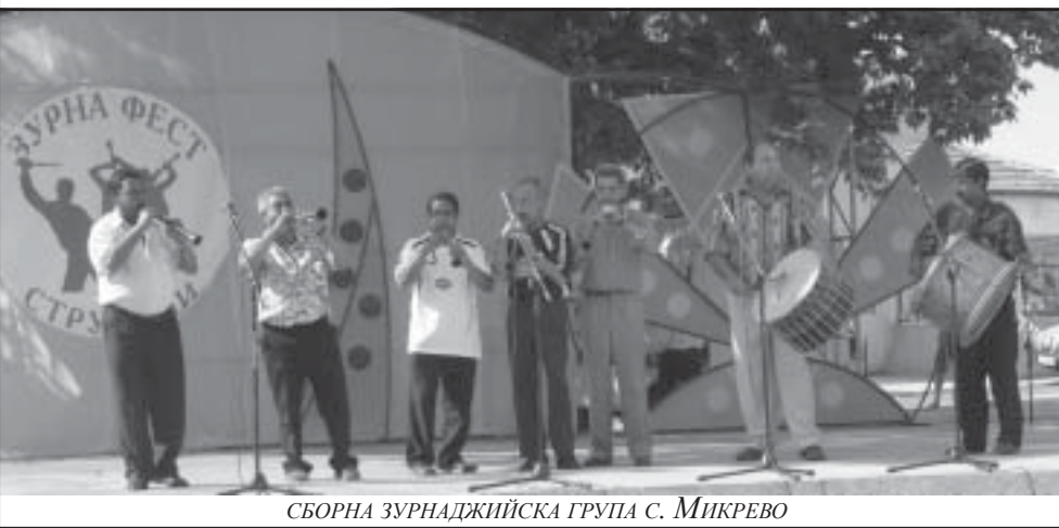
СБОРНА ЗУРНАДЖИЙСКА ГРУПА С. МИКРЕВО