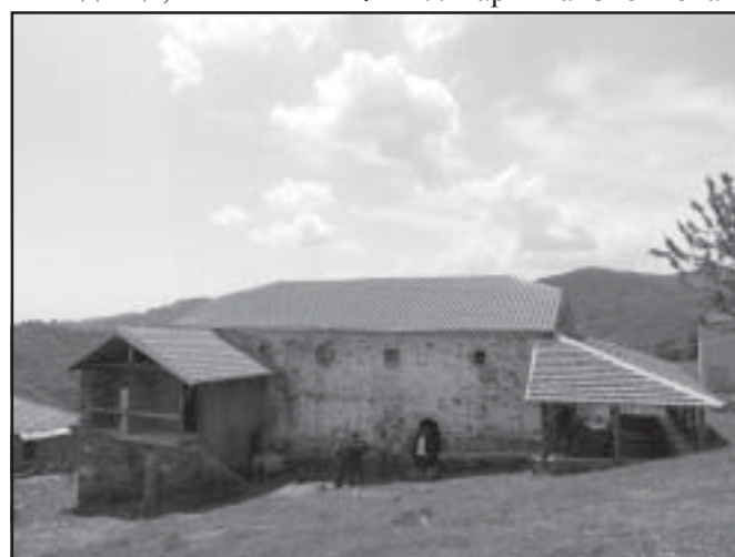
Килийното училище в с. Горна Рибница, бe реставрирано, със средства, предоставени безвъзмездно от „Ротари клуб” – гр. Сандански и Община Струмьяни