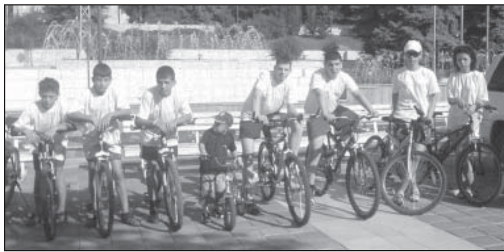
Младите велосипедистите от Струмяни на площада в Сандански

На 15 юни /петък/ в 9 часа на площад "България" в Сандански, бе даден старт на петата колоездачна обиколка на Пирин. "Обиколката на Пирин" е колопоход с идеална цел и няма състезателен характер. Целта на мероприятиято е укрепване здравето и духа на подрастващите. Тази година обиколката бе посветена на борбата с наркотиците. Организатори на мероприятиято са Комисията за борба срещу противообществените прояви на малолетни