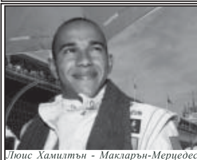
Люис Хамилтън - Макларън-Мерцедес

Пилотът на Макларън-Мерцедес Люис Хамилтън победи своя съотборник Фернандо Алонсо и спечели категорично втората си поредна победа във Формула 1 в състезанието на пистата "Индианаполис" за Гран при на САЩ. Във временното класиране при пилотите Хамилтън вече води с 10 точки на Алонсо и битката за титлата тепърва предстои. Двойната победа за Макларън-Мерцедес позволи на тима да дръпне с 35 точки на Ферари при конструкторите. Следващата надпревара от календара е на 1 юли на пистата "Маникур" за наградата на Франция.