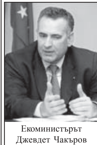
Екоминистърът Джевдет Чакъров

"Едва ли ще направим старите коли изцяло непродаваеми, но ще стимулираме употребата на нови автомобили", посочва Чакъров. Той коментира още и квотите за емисии на парникови газове. Според него решението на Еврокомисията, което редуцира квотите ни с 20 на сто за 2007 г. и с 37 % за 2008-2012г, е погрешно.