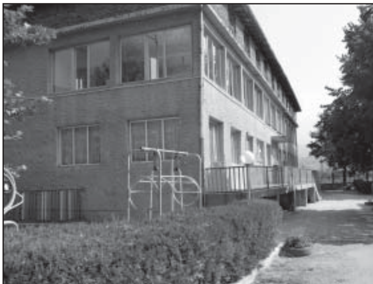
Сградата на ОДЗ "Снежанка", с.Микрево, общ.Струмьяни

"Коледни обреди и обичаи" бе темата на вътрешно-квалификационния курс, проведен от доктор Камелия Грънчарова с педагозите от с.Микрево на 13 декември.