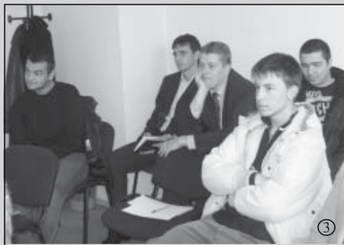
Лекциите протекоха при засилен интерес.

Във вторник лекциите продължиха от 8 до 12 часа, като на тях най-засегнатата тема беше, кога охранителите имат право да използват своето огнестрелно оръжие и кога могат да го носят със себе си. Преди да им бъде връчено удостоверение, че са преминали курса, участниците трябва да минат през психолог и разбира се да издържат изпита, който започна от 10:00 часа в четвъртък. Издържалите изпита ще бъдат уведомени кога и как ще получат своето удостоверение.