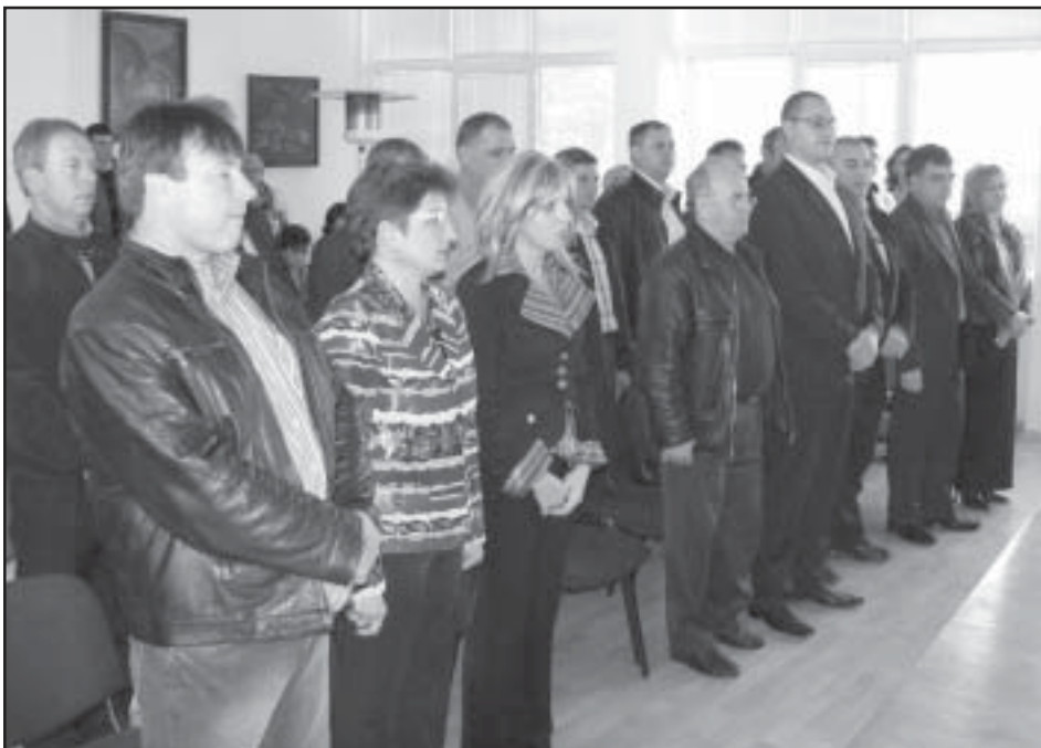
Новоизбраните общински съветници и кметове на кметства в община Струмяни дружно изрекоха клетвените слова и официално встъпиха в длъжност в препълнената зала на читалище "Будител", Струмяни

Отслужена бе и литургия за здраве и успех през предстоящите четири години.