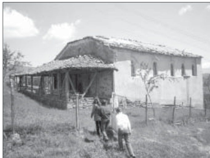
църква в с.Горна Рибница

Къщите паметници на културата са над 50 на брой. Те са типичен представител на характерния за района архитектурен тип. Най-ярките „експонати на открито“ са Граматиковата и Тошевата къщи намиращи се в с. Палат. През XIXв. Силно развитото дюлгерство оформя в Пиринския край самобитна строителна школа. Под влияние на западнобългарската и родопската къща в района на планините Огражден и Малешевска се появява огражденско-