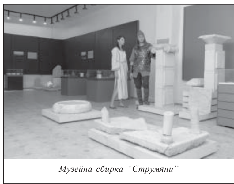
Музейна сбирка “Струмьяни”

Не може да не се обърне внимание и на фосилните останки от животински видове срещащи се по тези земи преди милиони години. Палеонтологичното находище се намира в землището на с. Илинденци. Тук са открити праисторически останки от коне – хипариони. Те са по-примитивни, по-малки на ръст. Тяхната особеност е, че вместо копито, на всеки крак имат по три пръста, затова специалистите ги наричат трипръсти. В Европа хипарионите са изчезнали преди около два милиона години, а са се появили преди около 11 милиона години. Техният вид е със стратиграфско значение. Това е най-масовият фаунов вид за късния миоцен, който обхваща период от преди 11 до преди 5 милиона години. От същото находище са регистрирани и други останки, най-вероятно от носорог и жираф.