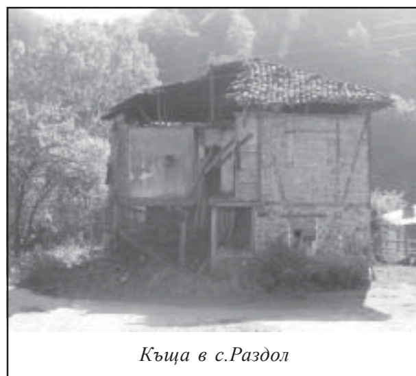
Къща в с.Раздол

Кмета на Община Струмляни Населените места, в вече които са регистрирани определи комисия за подобни сгради „запла-