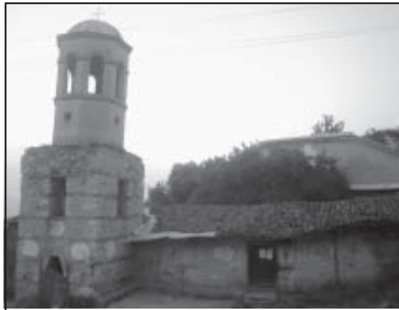
църква в с.Палат

Преобладава двуетажното едноделно или двуделно жилище. На долния етаж обикновено са избите и помещенията за животните, а на горния – жилищните помещения.