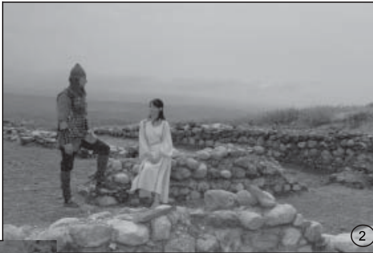
Снимки 1, 2 - Раннохристиянската епископска базилика в м. “Долното Градище” до с. Микрево

Етнографската тема е представена от експонати свързани с литургията, старопечатни книги издадени в Цариград, автентични носии от Малешевско, уреди за обработка на прежда и тъкане. Тук също има много представители на възрожденската битова керамика. Много добре запазено въстаническо оръжие, както и факсимилета, литографии и преписки на заповеди и кореспонденция на населяващите тези земи по време на турското владичество. Тук може да се види оригиналният буквар от килийното училище, което е първо в цяла Мелнишка околия и е открито през 1827г. в двора на църквата, която също е паметник на културата. Могат да се намерят представител характерната за провинция Македония т.нар. “сива македонска”, луксозната за това време “римска червенолакова”, както и най-ранната - гръцката керамика. Източник на изследванията относно керамиката и населението, което я е изработвало, дадоха тракийските култови ями от проучения чрез сондажи обект – тракийско ямно светилище. Обекта се намира отново в местността “Градището”. Ямното светилище е от втората фаза на ранножелязната епоха, която съвпада с архаичната епоха в Гърция. Откритите керамични фрагменти са в субгеометричен стил от кр VIII, VII, VI в. пр. Хр. Това е първата керамика въртяна на колело в древна Тракия.