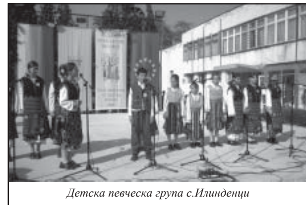
Детска певческа група с. Илинденци

Република Гърция Съвсем естествено часове преди откри-