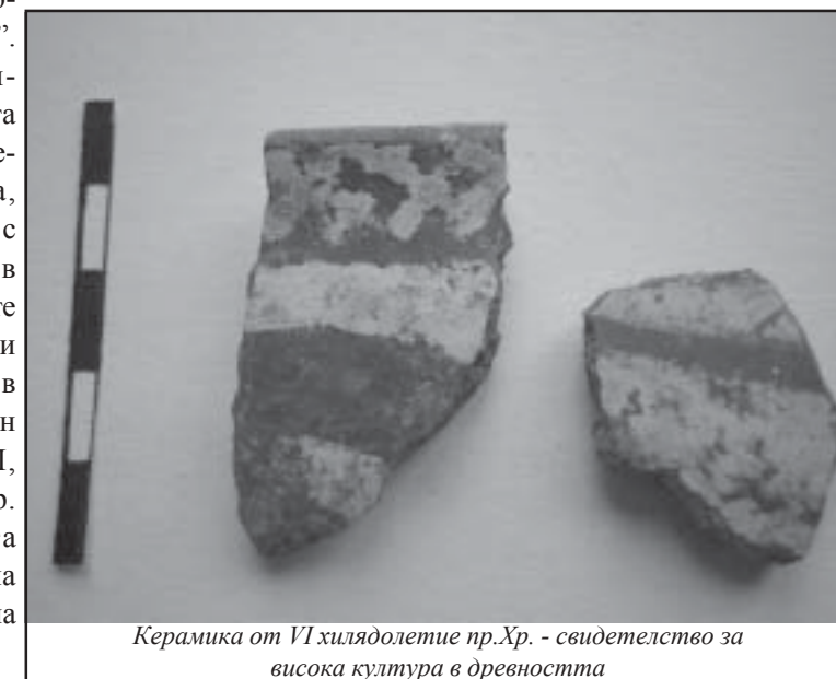
Керамика от VI хилядолетие пр.Хр. - свидетелство за висока култура в древността

не, което запазва традициите си. Основна военна функция на града е опазването на важната пътна артерия по река Струма. Сред населението тук са разпространени и култове към различни божества Дионис, Бендиди,