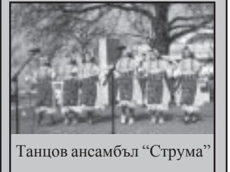
Танцов ансамбъл “Струма”

На 08.10.2006 г. деца от танцови състави “Струма” към читалище