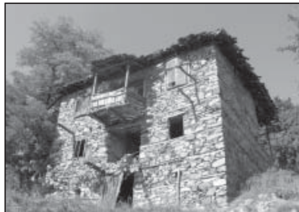
къща в малешевско-огражденски стил