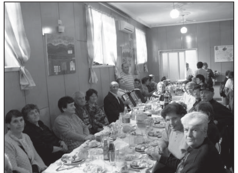
Пенсионерите в Струмани имаха също повод да празнуват